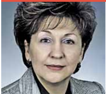
Депутат Государственной Думы Галина Карелова:

— Основными задачами бюджетной политики в социальной сфере на 2013 год определены улучшение условий жизни граждан, усиление адресной помощи нуждающимся, повышение качества государственных и муниципальных услуг.